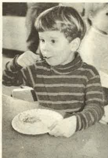
Kauniit ruokailutavat ovat Torppiksessa kunniaa.

Kun leikit on leikitty ja tavarat laitettu paikalleen, on ruokailun aika. Kädet pestään ja eväät kaitetaan omasta kerhorepusta esiin. On ehkä päivän tärkein