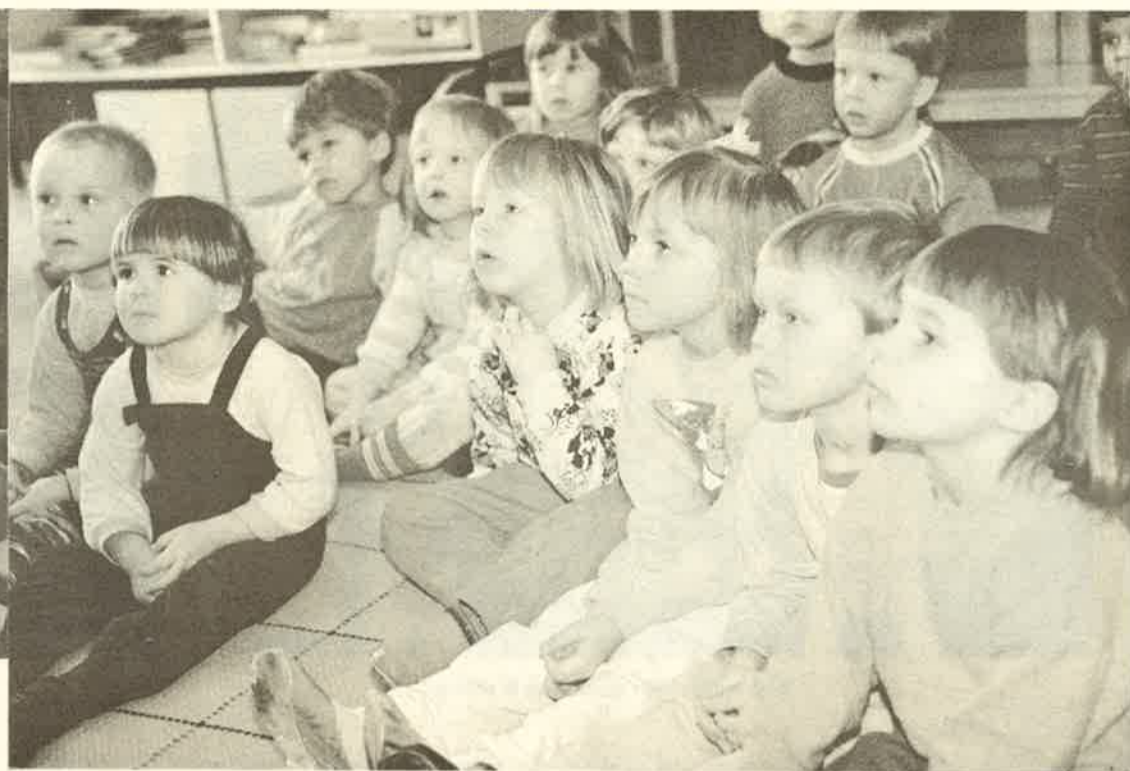
Sadut rikastuttavat lapsen maailmaa. Niitä luetaan Torppiksessa päivittäin.

Teatteriesitykset, niin lasten kuin aikuistenkin tekeminä, ovat yksi osa Torppiksen toi-