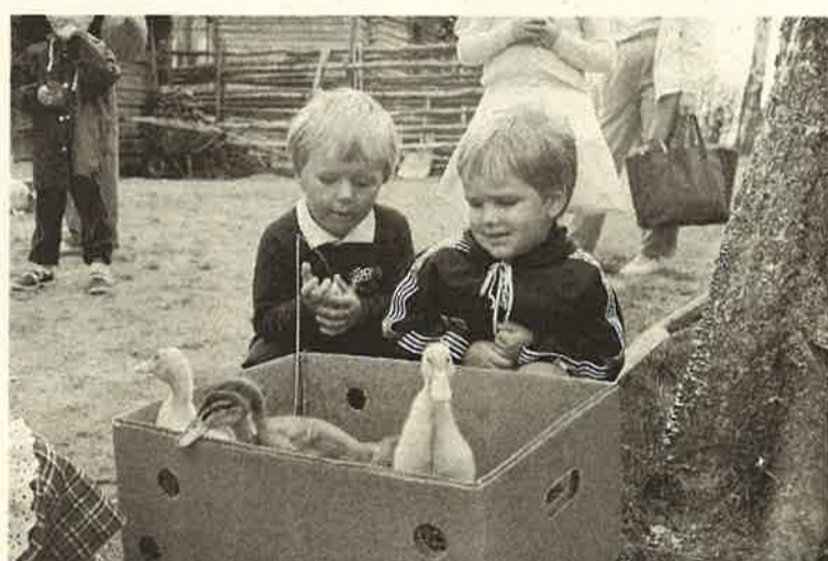
Retkeily avartaa, vai mitä ankat?

Torppis toimintoinen ja juhlineen on vuosikausia ollut osa elämää. Kun se nyt kuopusten koulun alkamisen myötä loppuu, jää mieleen kiitollinen haise. Se oli mukavaa niin kauan kun sitä kesti. Torppishengen luomisesta kiitos kuuluu torppistadeille. Siis kiitos ja hyvää jatkoa.