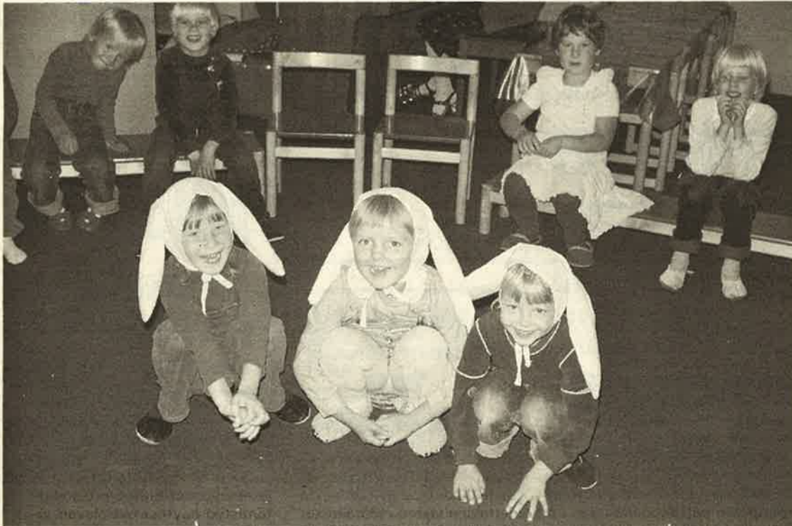
Leikki on tärkeä osa Torppista, se kasvattaa, virkistää ja usein naurattaa.

Yksityisen päiväkodin toiminnan jatkuvuus edellyttää nimenomaan aktiivisten ja yhteistyökykyisten vanhempien ja henkilökunnan yhteistä työtä. Tästä Torpanperän päiväkoti on ollut onnistunut esimerkki. 15 toimintavuotensa aikana Torpanperän päiväkoti, Torppis, on ollut yli 1000 lapselle turvallinen leikkipaikka, on edelleenkin ja näin on syytä uskoa olevan tulevaisuudessakin.