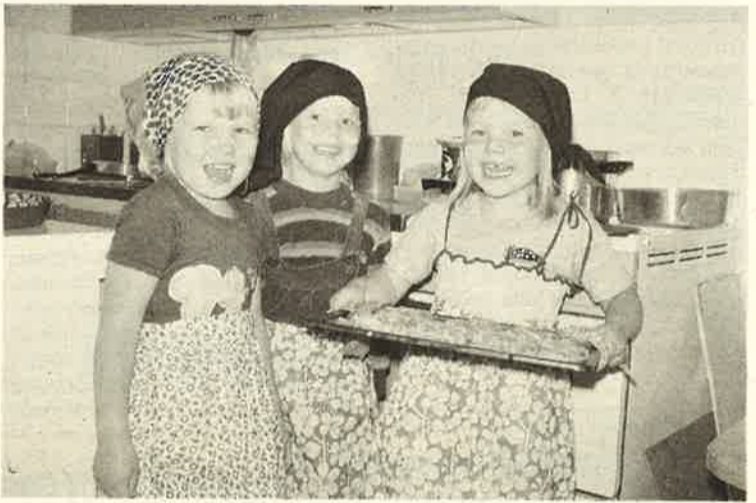
"Mitäs me paakarit"