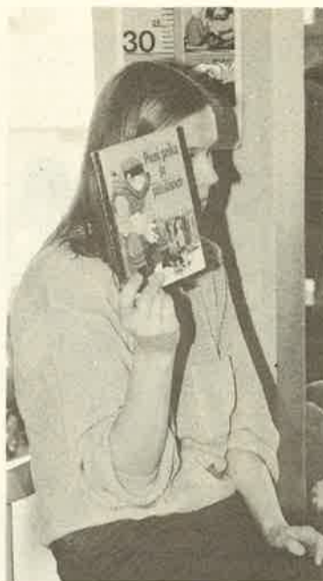
Opitaan myös uutta tietoa. Tällaisia asiakokonaisuuksia nimetään keskusaiheiksi.

Kun laulut on laulettu, keskustellaan lasten kanssa heille läheisistä ja tutuista asioista.