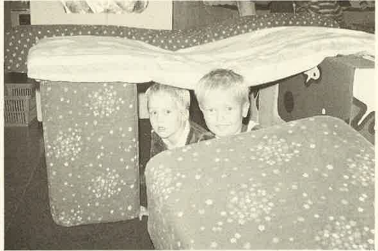
"Löytääköhän ope meitä täältä"

Johtokunnan alaisuudessa on alusta saakka toiminut kaksi toimikuntaa, jotka nykyisin ovat nimeltään yhteistyötoimikunta ja lehtitoimikunta. Yhteistyötoimikunnan tehtävänä on edistää päiväkodin ja kotien välistä yhteistoimintaa. Se on mm. järjestänyt talkoita, retkiä, kevät- ja joulujuhlia sekä vanhempainiltoja. Useat yksityiset henkilöt sekä liikelaitokset ovat avustuksellaan tehneet mahdolliseksi monet tilaisuudet. Vanhempainiloissa on ollut mukana kasvatust- ja terveysalan asiantuntijoita. Tiedotuslehti Torppis on vuodesta 1976 lähtien ilmestynyt kerran vuodessa. Lehden ensisijaisena tarkoituksena on ollut päiväkodin ja sen toiminnan tunnetuksi tekeminen Kortepohjan alueella. Molemmista toimikunnissa on ollut mukana sekä päiväkodin henkilökuntaa että lasten vanhempia.